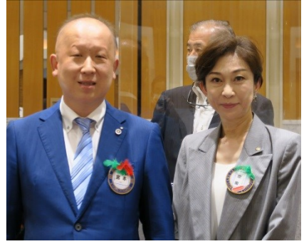
宮本会員 お誕生日おめでとうございます