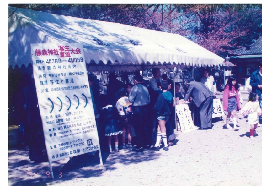
’93-94年度 藤森神社写生・書道大会 第2回写生大会は75～76年度藤森神社にて開催され、 PRの甲斐もあって応募数が激増した。