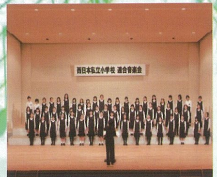
京都聖母学院小学校合唱団